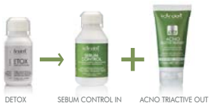
DETOX SEBUM CONTROL IN ACNO TRIACTIVE OUT