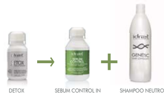
DETOX SEBUM CONTROL IN SHAMPOO NEUTRO

POROS DILATADOS TRATAMIENTO PORE REFINER