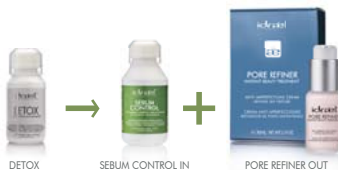
DETOX SEBUM CONTROL IN PORE REFINER OUT

POROS DILATADOS TRATAMIENTO PORE REFINER